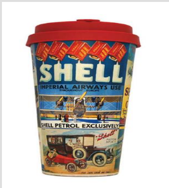
2024年我们给壳牌石油 推荐并成功定制的咖啡渣咖啡杯。